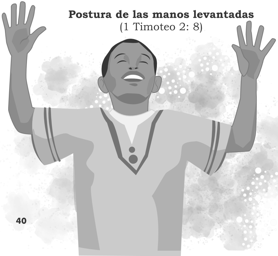
Postura de las manos levantadas (1 Timoteo 2: 8)