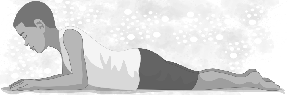
Postura tumbada (Salmo 149: 5)